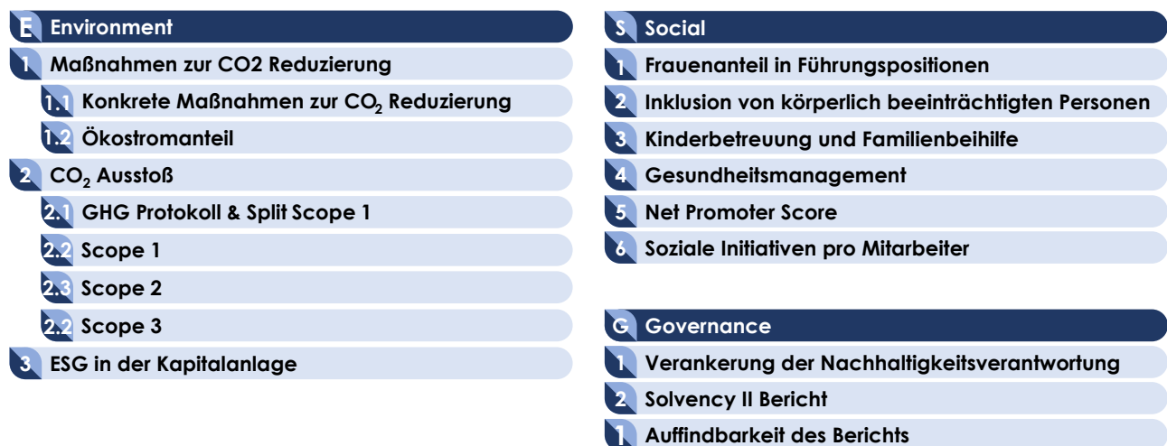
Abbildung 1: Kriterien in den Bereichen Environment, Social und Governance

Folgende Kriterien ergeben sich für die Kategorien Environment, Social und Governance, die in der nachfolgenden Abbildung 1 aufgezeigt und im Verlauf der Studie näher definiert werden: